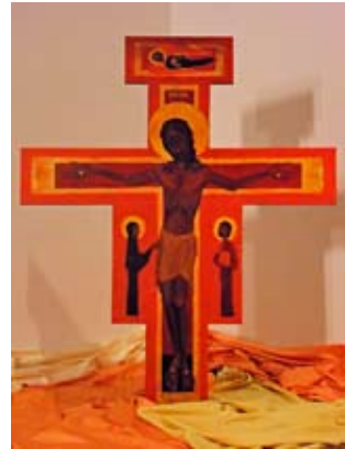
Kreuzikone aus Taizé

Die ökumenische Bruderschaft von Taizé lädt seit vielen Jahren Jugendliche und Erwachsene aus aller Welt zu sich ein. In einer Sommerwoche können sich teilweise bis 4.000 Menschen im Camp aufhalten. Die Tage werden strukturiert durch drei Gebetszeiten, die von den typischen Gesängen geprägt sind. Diese einfachen und zugleich schönen Gesänge können gleichzeitig in mehreren Sprachen gesungen werden. Sie führen zur inneren Ruhe in Christus. Jeden Vormittag wird in internationalen Gruppen an einem Bibeltext gearbeitet. Nachmittags werden Workshops angeboten. Die Unterkünfte sind sehr einfach gehalten. Jede und jeder muss mitarbeiten, damit das gemeinsame Leben gelingen kann. Die Einfachheit ist Programm: Wir ahmen darin die Armut Jesu Christi nach. Zudem ermöglicht die Einfachheit, dass die Kosten niedrig gehalten werden können. Wir als Deutsche müssen allerdings für Übernachtung und Verpflegung einen höheren Beitrag (Erwachsene: 200-225 €; Jugendliche etwa 150 €) zahlen als z.B. Christen aus Afrika. Das ist ein Zeichen der geschwisterlichen Solidarität. Wir reisen in PKW-Fahrgemeinschaften, die sich in die Fahrkosten teilen. Anmeldung so bald wie möglich, aber spätestens bis 19. Juni im Pfarramt der Johanniskirche. Wenn wir weniger als acht Teilnehmer sind, kann die Fahrt nicht stattfinden. (HR)